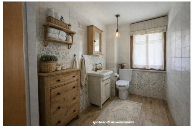
Ipotesi di arredamento