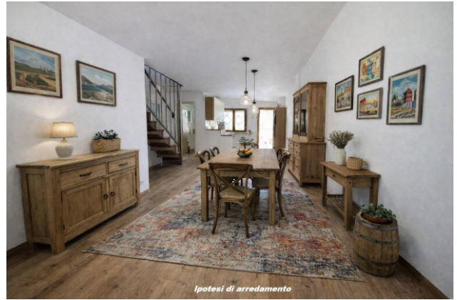
Ipotesi di arredamento