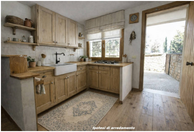
Ipotesi di arredamento